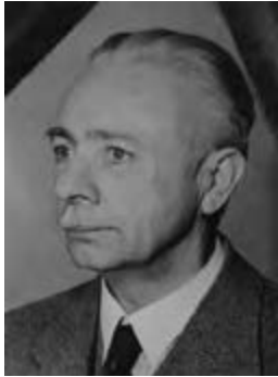
Abb. 1: Wilhelm Jost, nach 1940.