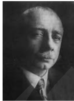
Abb. 3: Wilhelm Jost, um 1920.

Architekturstudium an der Technischen Hochschule seiner Heimatstadt. 16 Später stellte Jost fest, dass seine Neigung zur Architektur möglicherweise auf seinen Vater zurückzuführen war, der auf seinem Abgangszeugnis den Wunsch vermerkt hatte, „Architekt werden zu wollen“, dann jedoch eine juristische Laufbahn einschlug. 17