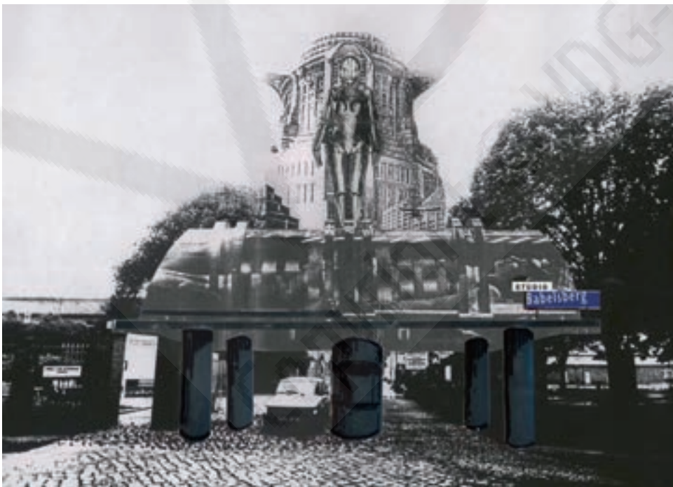
Abb. 1-2 Alfred Hirschmeier: Zwei von fünf Entwürfen für den Eingangsbereich des Studios Babelsberg, frühe 1990er Jahre, Fotokopien von Fotocollagen und Spiegelfolie mit Einzeichnungen in Filzstift.