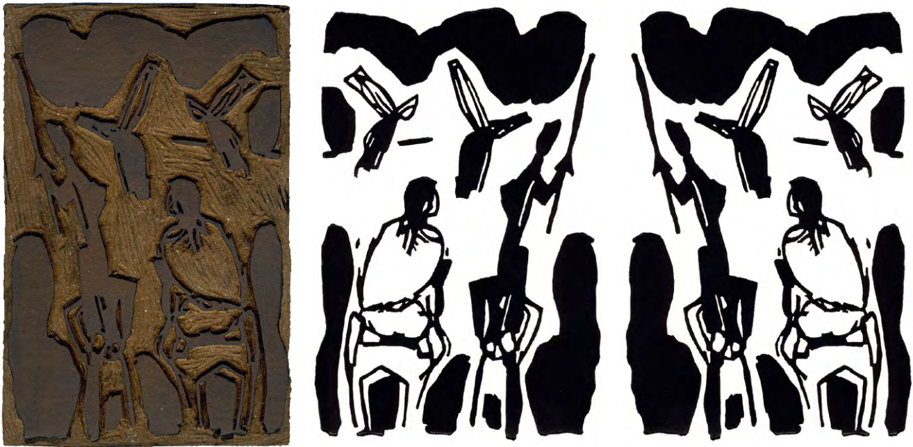
Abb. 3-5: Die Seitenausrichtung im Linolschnitt Don Quikong (= Darstellung Don Quijotes mit Sancho Panza): Links die mithilfe einer spiegelverkehrten Pauszeichnung erstellte Druckform mit Linksneigung; mittig der dazugehörige druckgraphische Abzug mit der Darstellung in gewünschter, der ursprünglichen Bildidee entsprechenden Rechtsneigung; rechts die rein virtuelle digitale, auf die Spiegelung der Graphik in der Mitte mit einem PC-Bildbearbeitungsprogramm zurückgehende Darstellung mit Linksneigung, welche das Bild diffus unstimmig erscheinen lässt; diese rechte gespiegelte Abbildung entspricht in etwa (abgesehen von leichten Abweichungen infolge des Schneidvorgangs) der Pauszeichnung, welche der Übertragung mit Blaupapier auf den linken Druckstock zugrunde lag.

Und auch für die Komposition selbst ist es nicht unerheblich, ob Personen oder Gegenstände – sprich die optischen Gewichte des Bildes – innerhalb der Darstellung links oder rechts angeordnet sind. Genau dieser Thematik widmete Wölfflin zwei Essays 20 , in denen er u. a. darauf hinwies, dass der Betrachter die linke und rechte Seite eines Bildes per se unterschiedlich wahrnimmt und gewichtet: