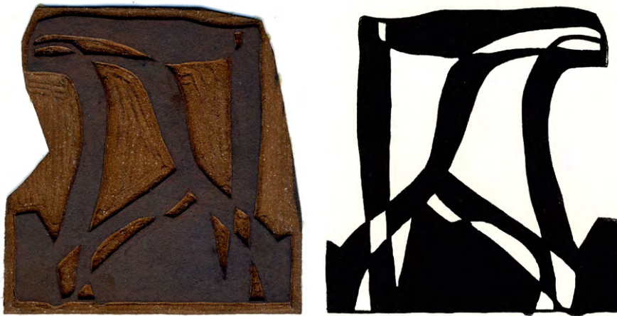
Abb. 1-2: Seitenumkehrung im Hochdruck: Links die Linolplatte mit nach links ausgerichtetem Affen; daneben die Darstellung auf dem hiervon abgezogenen Linolschnitt Kapuzineraffe in entgegengesetzter seitlicher Ausrichtung.

Im Hochdruck verhält sich die Darstellung auf der Druckform immer genau spiegelbildlich zu dem von ihr direkt (d. h. ohne ein Umdruckpapier) genommenen druckgraphischen Abzug. Schreitet also ein auf der Linolplatte dargestelltes Tier, wie unten zu sehen, nach links, so bewegt es sich auf der entsprechenden Graphik logischerweise genau in die Gegenrichtung: