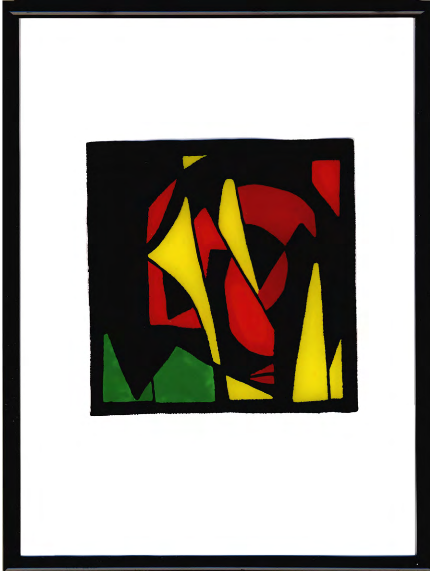
„Schaffen von Formen heißt: leben.“ 1 August Macke